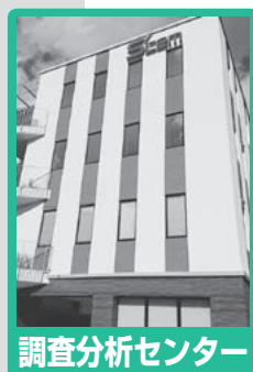
調査分析センター