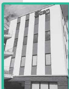
調査分析センター